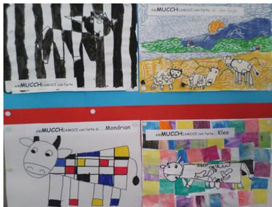
Mucche ad arte