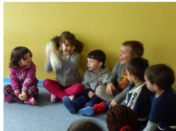
Facciamo il burro