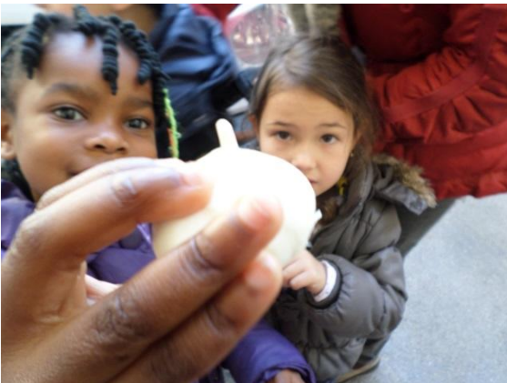
Mozzarelline latteria di Aviano