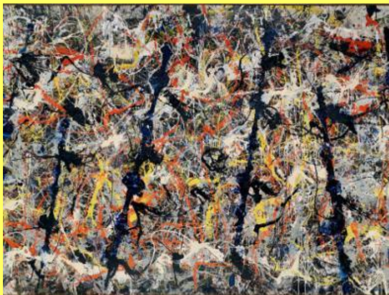
“Pali blu” – J.Pollock