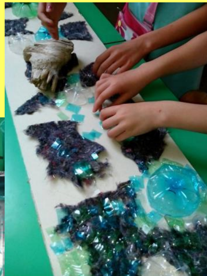
...al nostro torrente ecocompatibile!