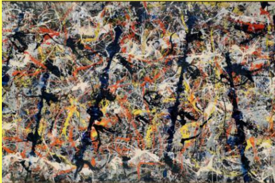
“Pali blu” – J.Pollock