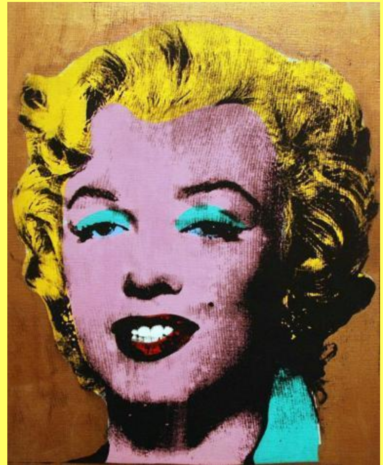
4^C A. Warhol