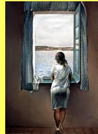
“ Ragazza alla finestra” S. Dalí