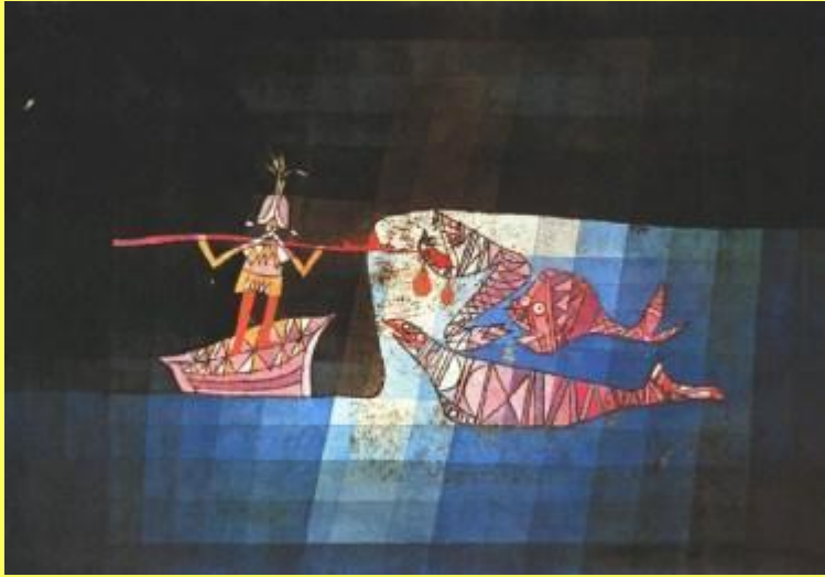
1^B P. Klee