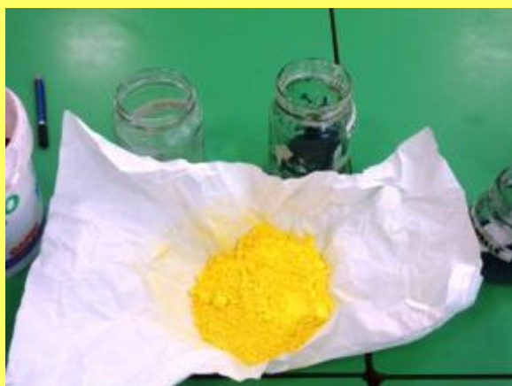
Classi 3 A e 4 C laboratorio su COLORE ED EMOZIONI