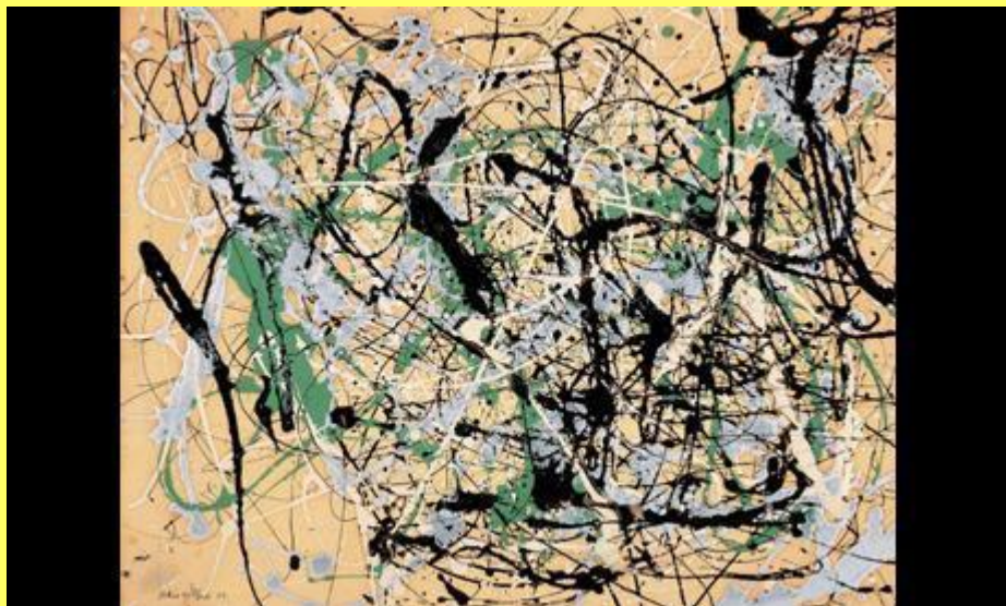
Rhythmical dance number 26 number