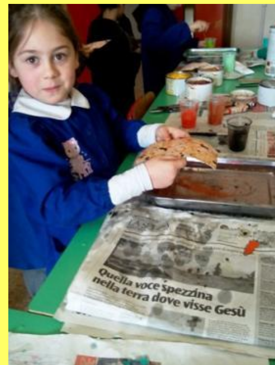
Classe 1 B laboratorio sull' ACQUA