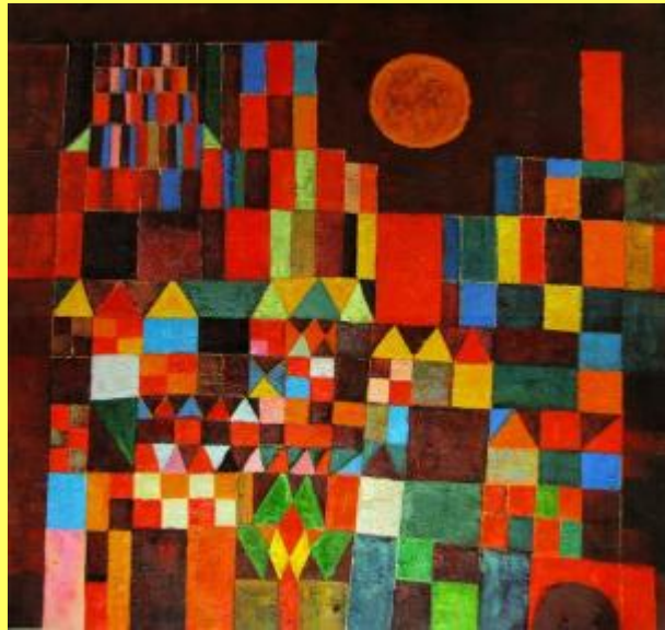
“Castello al sole” – P. Klee

Lettura delle opere d'arte sia attraverso un approccio emozionale, sia attraverso la conoscenza degli elementi caratterizzanti i diversi stili .