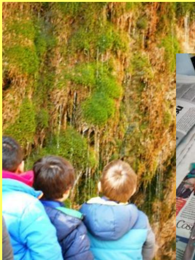
Dalla sorgente reale...