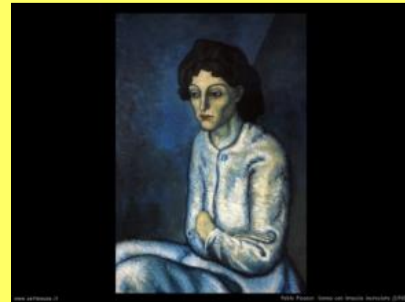
“Donna con le braccia conserte” P.Picasso