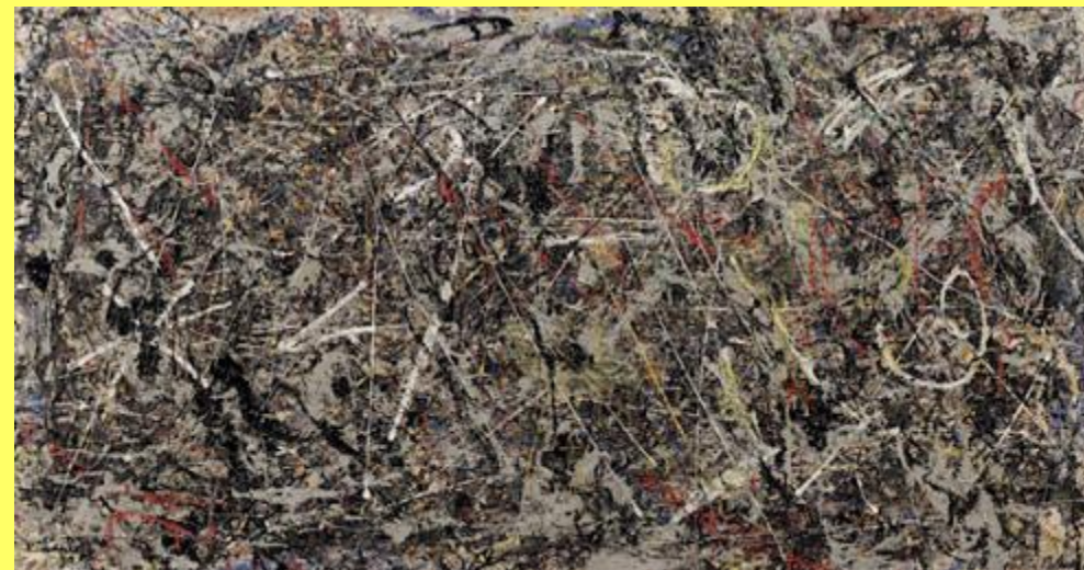
Arte del corpo: il gesto nell'arte

L'energia del colore tra fisica, chimica e linguaggio